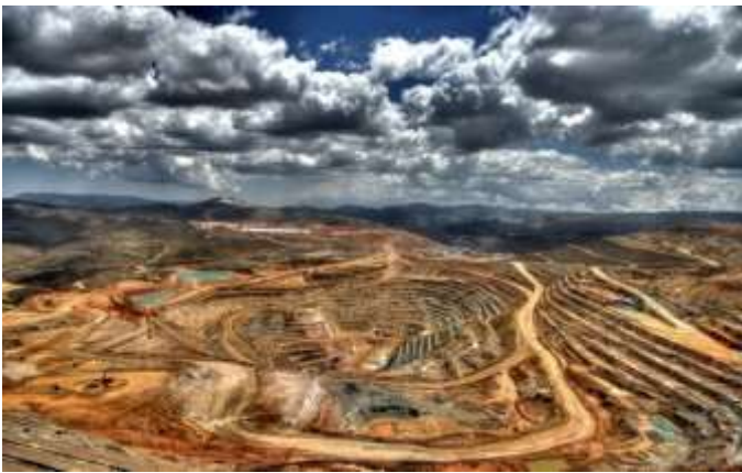
نقشه راه و تب معادن بورژوازی آینده ای به همین اندازه سیاه و ترسناک را در آستین دارد.

اعتصاب مس کرمان تازه ترین اعتصاب معدنچیان شامل چهار هزار کارگر اعتصابی از یک طرف، و تحصن طلای آقدره و سرسختی توقف رفت و آمد به محوطه معدن از طرف دیگر مستندات تازه ای از تب معادن در ایران است. در تجربه اعتصابات معدن دو بخش متفاوت از یک صنعت اما با خواستها و مطالبات یکسان دست به مبارزه زدند. ستیزه جویی به روش آقدره و وجود روشها و سنت های همپشتی و همبستگی سراسری معدنچیان اوهام و خوابهای پنبه دانه بورژوازی را باطل کند. طبقه کارگر ایران باید چوبدستی توهم به قانون کار، خیالات به بازی گرفتن پادوهای خانه کارگر را کنار بگذارد. طبقه کارگر چاره ای ندارد جز اینکه برای خلع ید کامل از بورژوازی خیز بردارد. معادن باید به قبرستان همه تلاش و همه دست درازی بورژوازی علیه طبقه کارگر تبدیل شود. نباید گذاشت کوهها و کوهپایه های ایران غرق در سموم ناشی از کارکرد معادن، و معادن میدان بهره کشی وحشیانه به قتلگاه طبقه کارگر برای نسل های آتی باقی بماند.